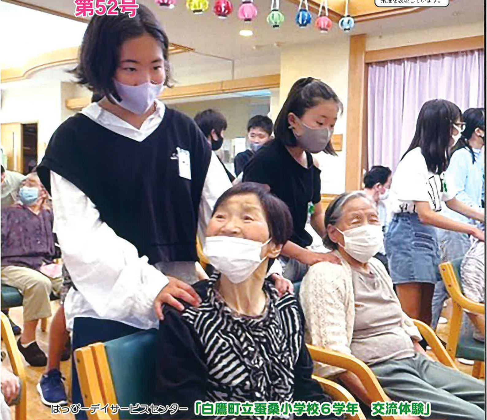
はっぴーデイサービスセンター「白鷹町立蚕桑小学校6学年 交流体験」