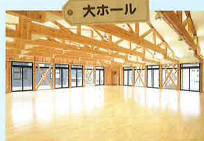
旧白鷹町立西中メモリアルコーナー