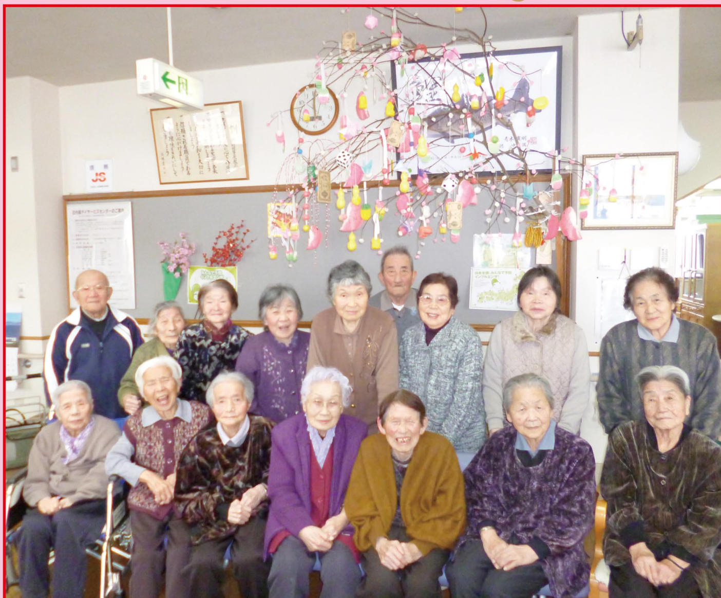
白光園デイサービスセンター だんごさげ