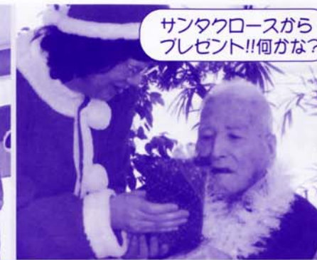
サンタクロースから プレゼント!!何かな?