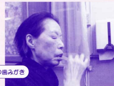
夕食後の歯みがき