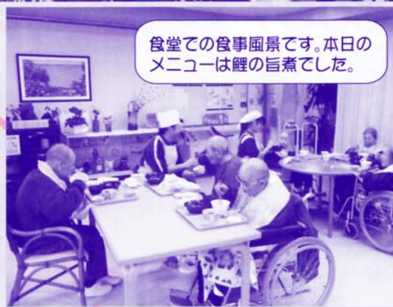
食堂での食事風景です。本日の メニューは鯉の旨煮でした。