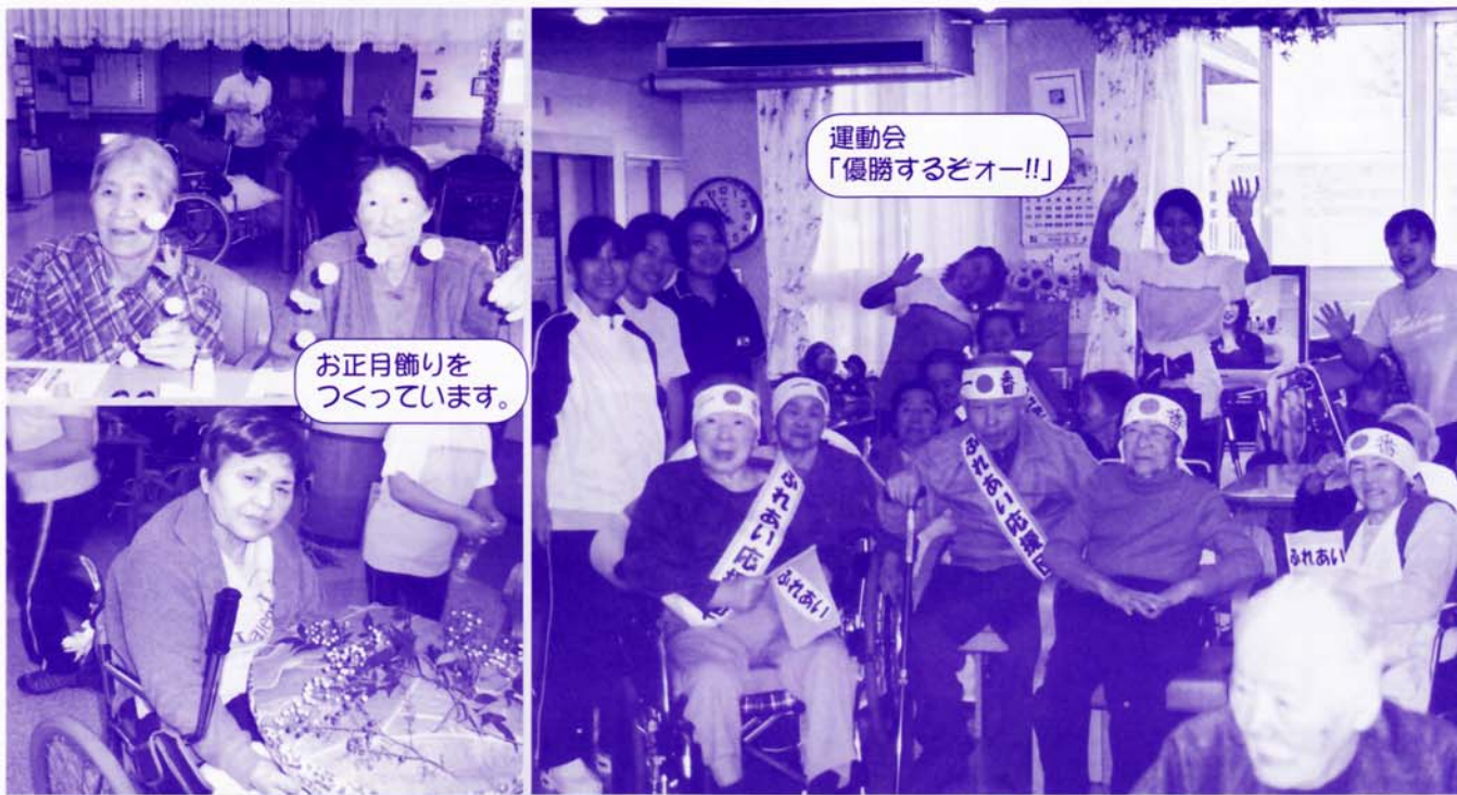
運動会 「優勝するぞー!!」