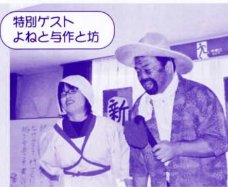
特別ゲスト よねと与作と坊