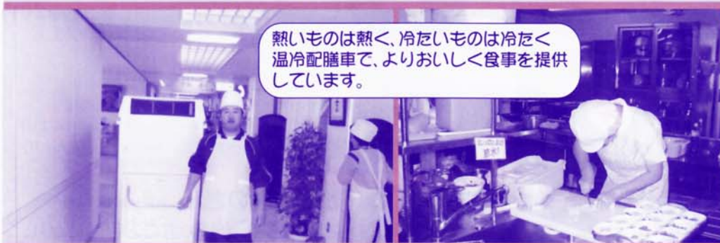
熱いものは熱く、冷たいものは冷たく 温冷配膳車で、よりおいしく食事を提供 しています。