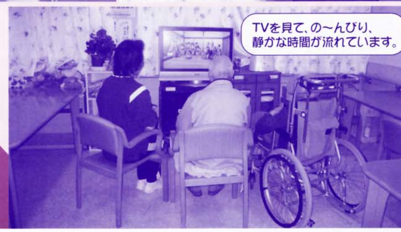
TVを見て、のんびり、 静かな時間が流れています。