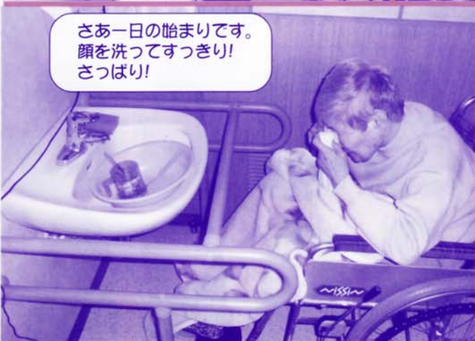
さあ一日の始まりです。 顔を洗ってすっきり! さっぱり!