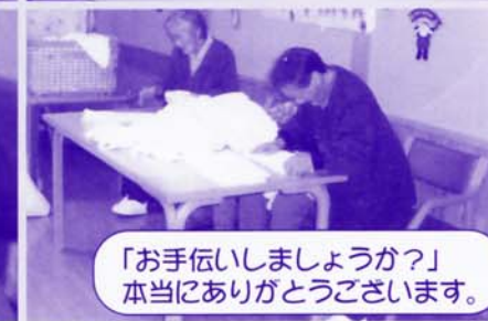
「お手伝いしましょうか?」 本当にありがとうございます。