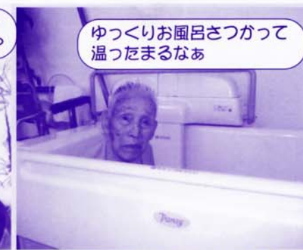
ゆっくりお風呂さつがって 温たまるなあ