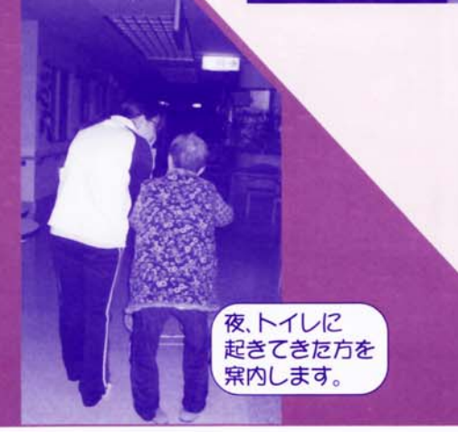
夜、トイレに 起きてきた方を 案内します。