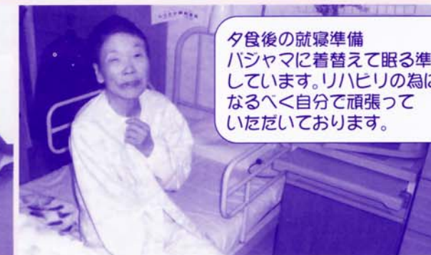
夕食後の就寝準備 パジャマに着替えて眠る準備を しています。リハビリの為に なるべく自分で頑張って いただいております。