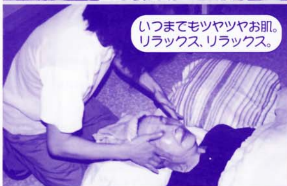
いつまでもツツツやお肌。 リラックス、リラックス。