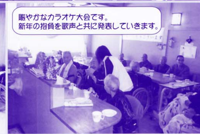
賑やかなカラオケ大会です。 新年の抱負を歌声と共に発表していきます。