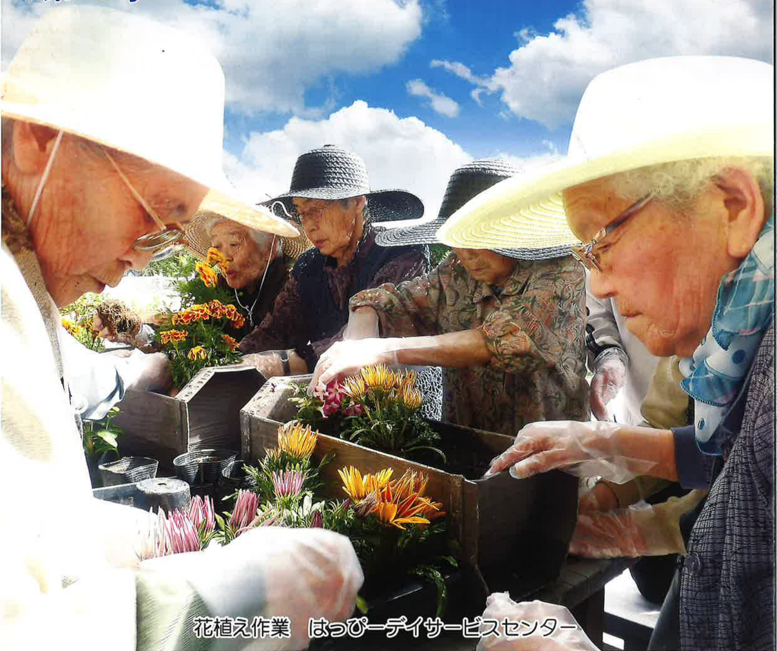
花植え作業 はっぴーデイサービスセンター