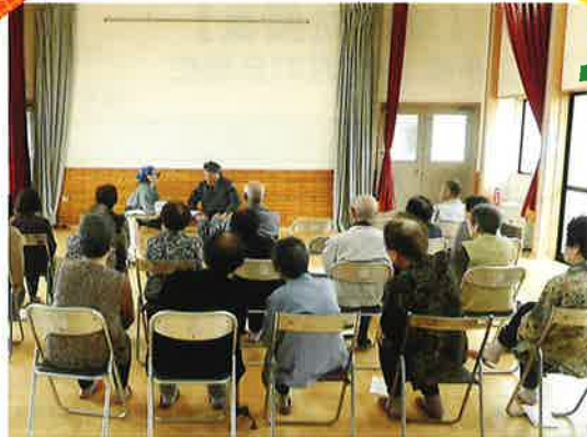
仲町ふれあいサロン

6月21日（木）十王地区上野ふれあいサロンへご招待頂きました。4月から新たに配属になった作業療法士による専門的な体操を皆様と行ってきました。また、職員による手品も楽しんで頂きました。