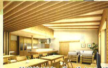
特養棟リビング・ダイニング キッチン(洋風)イメージ図