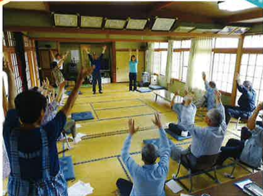
十王上野ふれあいサロン

6月21日（木）十王地区上野ふれあいサロンへご招待頂きました。4月から新たに配属になった作業療法士による専門的な体操を皆様と行ってきました。また、職員による手品も楽しんで頂きました。