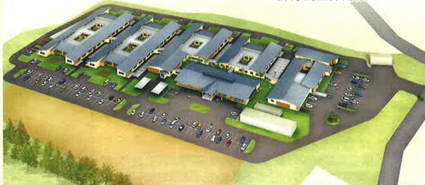
新特養全体外観イメージ

木造平屋建てで、白鷹産の杉の木を利用し、地元の資源を有効活用していきます。地域に根ざした、白鷹らしい暮らしを目指していきます。施設に入居されても、できるだけ在宅で過ごされた環境で、暮らしの継続が出来るように支援していきます。また、地域の皆様との交流をすすめていく地域交流棟も併設されます。地域の皆様にも大いにご使用いただきたいと考えています。軽スポーツ、集会などにいかがでしょうか？