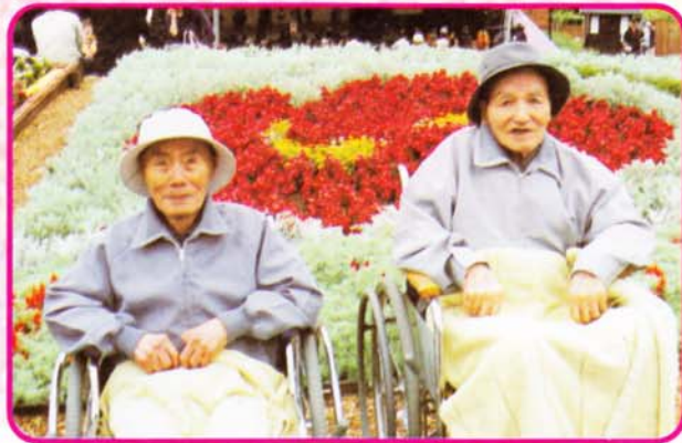
「いや～きれいだなあ ここで一杯やっか？」