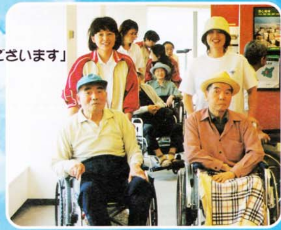
「山形で 一番高いビルでございます」