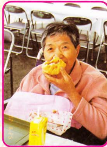
「んまいごと 初めて食べたトルコの味」