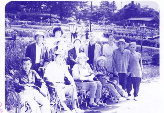
日本一のあやめにかこまれて