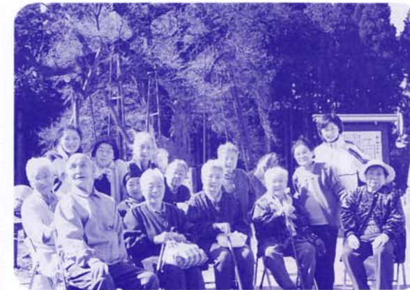
釜の越の桜はつぼみでしたが、温かいお茶のおもてなしに、皆さんの笑顔は満開でした

1週間に1度でも、地域の皆さんと、楽しい時間を過ごしてみませんか? ゆっくりお風呂につかり心身のリフレッシュをしにいらしてみ下さい。 スタッフ一同お待ちしております。