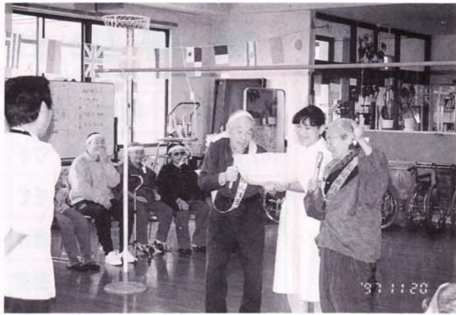
「おもしろおかしく腰をピンと伸ばして...と力強い選手宣誓」