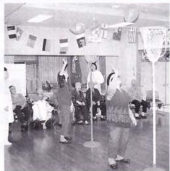
「この風船言うごときかね 俺の足腰と同じだ」