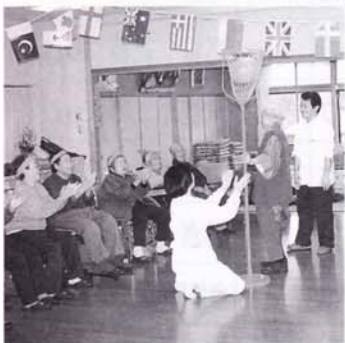
「へーどんなもんだい」 「一同拍手、」