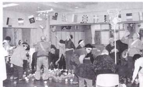
「まずいっぱいしょっていっぱい入れるべー」