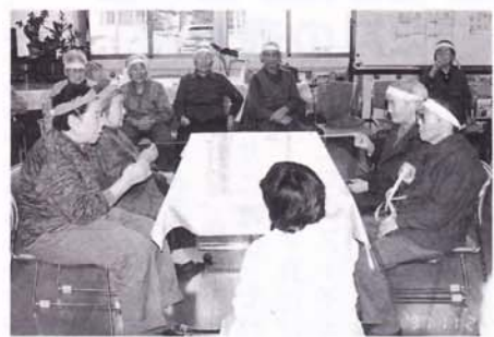
「よしよ、よしよ、このゲームは「力、でないなあ」技、だなあ」