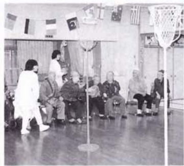
「風船割んねようにやさしく 早く送ってけるよー」