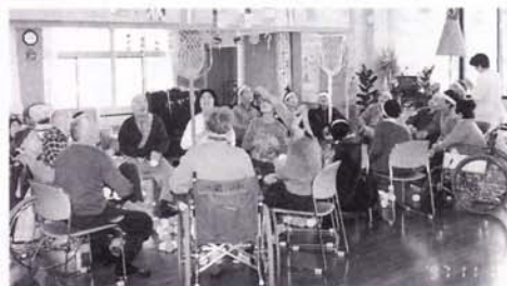
全員すわっての玉入れ「なかなか入んねもんだね」