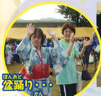
ほんおど 盆踊り... こんな感じでいいかしら