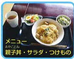
メニュー 親子丼・サラダ・つけもの

学園から少し離れて、アットホームな感じで食事を楽しむ、ご利用者とちよぼらの家スタッフの方々。毎週金曜日に、5名ずつでご利用させていただいております。昼食を挟んでの2時間くらいですが、楽しいひと時を過ごされて笑顔で、「おいしかった、楽しかった」と、学園に戻ってきます。