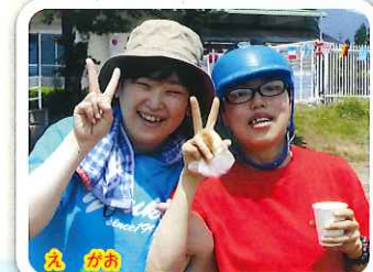
笑顔がはじけます。