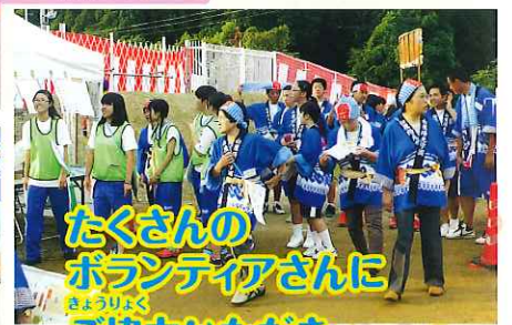
たくさんの ボランティアさんに ご協力いただき ありがとうございました