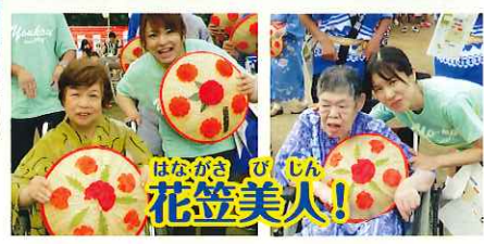
はながさ 花笠美人!