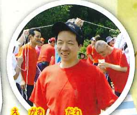
笑顔は誰にも 負けません。