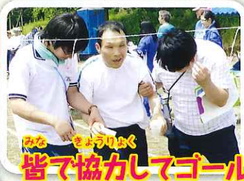
皆で協力してゴールを目指します。