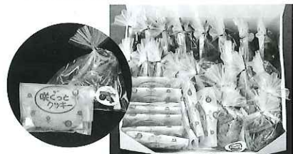
「手作りスイーツセット」