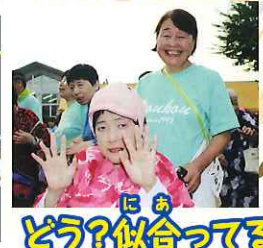
にあ どう?似合ってる~