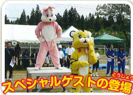
スペシャルゲストの登場