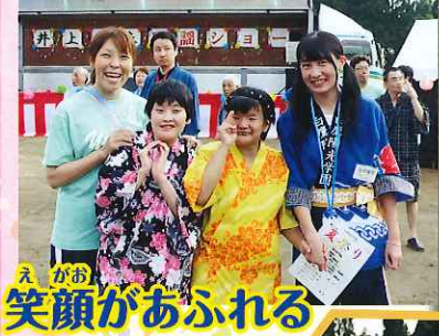
えがお 笑顔があふれる