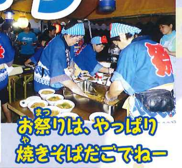
お祭りは、やっぱり 焼きそばだごでね~