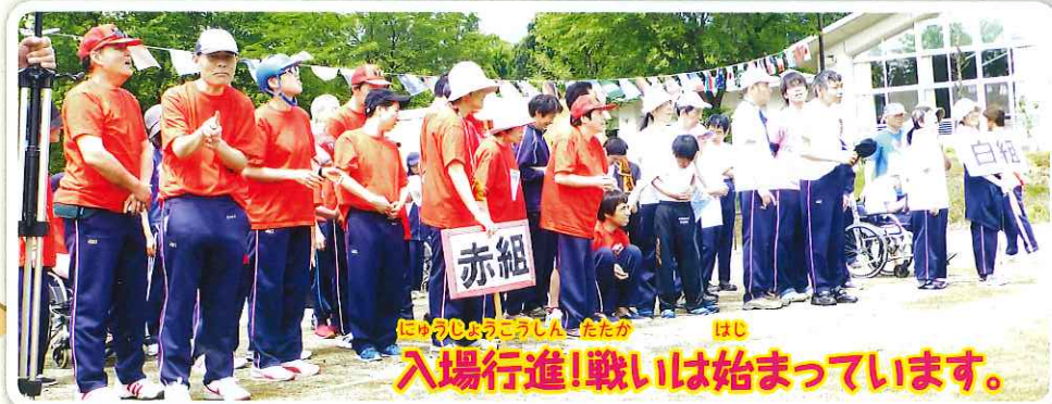
入場行進! 戦いは始まっています。