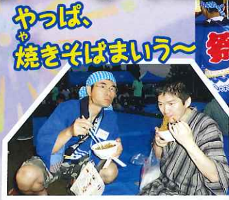
やっぱ、 焼きそばまいう~