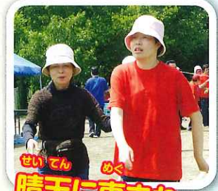
晴天に恵まれ あつい、あつい