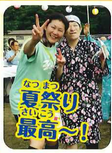
なつまつ 夏祭り 最高~!