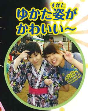
ゆかた姿が かわいい~