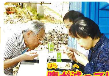
腹が減っては戦はできぬ。