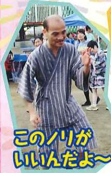
よっ 節屋 太鼓の達人!