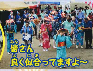
みな 皆さん にあ よく似合ってますよ~