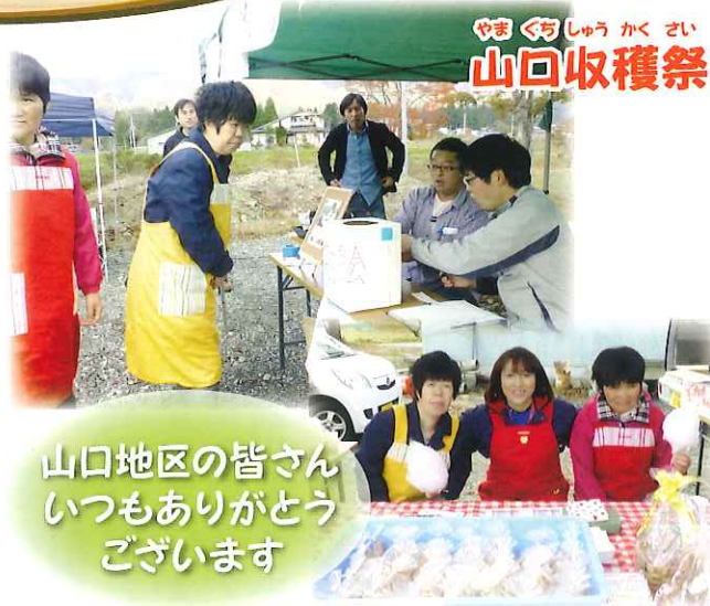
やま ぐち し ゅ う かく さい 山口収穫祭