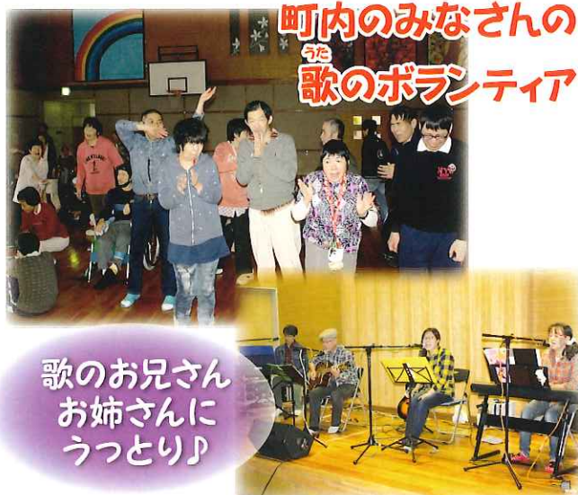
ち ょ う な い 町内のみなさんの 歌のボランティア