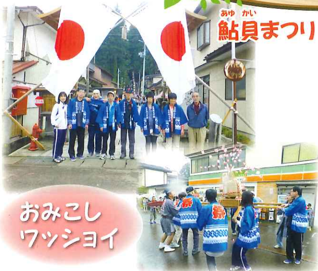
おみこし ワッショイ