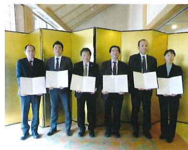
東北南ブロック関連施設と災害時の連携・支援に関する覚書