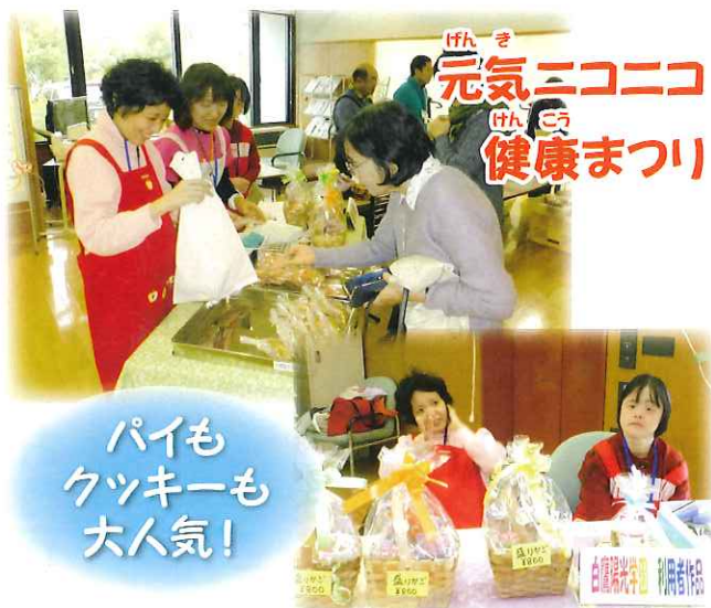
パイも クッキーも 大人気!