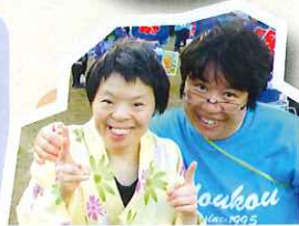
白鷹太鼓 ようしょうかい 鷹翔会