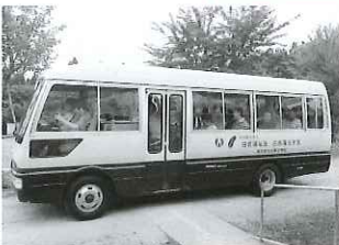
元気な男子グループ ドライブ大好きな人ばかりです。