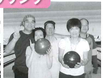
「ストライク!!!」 きょうのスコアは何点ですか。