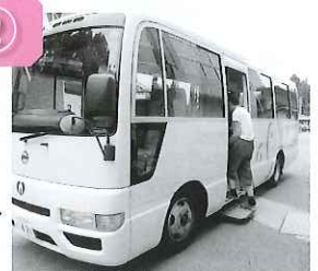
男女とも ドライブ大好き! 「出発進行」のかけ声、 きょうも元気で。