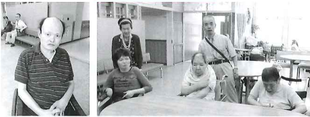
それぞれみんながのんびりすごします。 きょうは何をする？