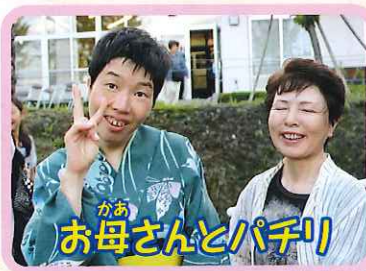
お母さんとパチリ