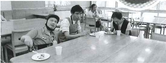
体育館でウォーキングや体操をしたあと、 みんなでクッキング!! きょうはたこやきです。