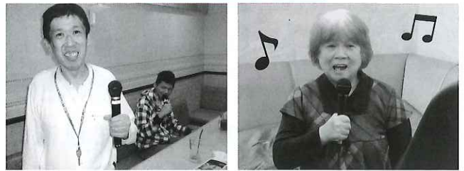
カラオケ大好きな人集まれ。 みんなのりのりです♪