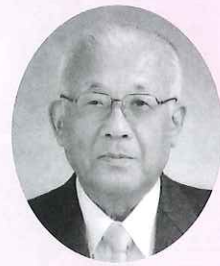
白鷹福祉会 理事長