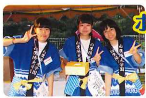
ボランティアの方と 一緒に!

てんこう よ ようこうがくえんじょう はつ はなび う あ こんねん ど 天候も良く、陽光学園上に262発の花火が打ち上がりました。今年度もたくさんの ボランティアのみなさんがお手伝いに来て下さり、大成功に終わることが出来ました。 ほんとう 本当にありがとうございました。