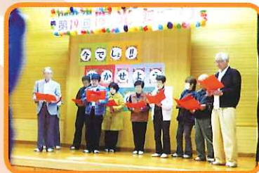
ほごしや かたがた 保護者の方々からの うた ステキな歌のプレゼント。 心がこもっています。