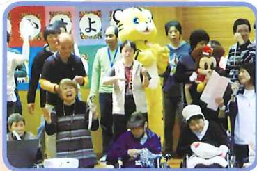
さいげん おかえりなさいコンサートの再現!