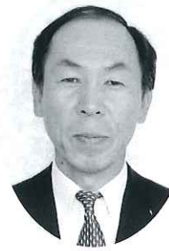
白鷹陽光学園 園長