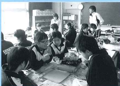
しらたかにしちゅうがっこう 白鷹西中学校