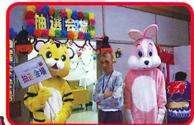
ちゅうせんかい てつた 抽選会のお手伝い。