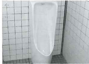
西棟男子トイレ改修