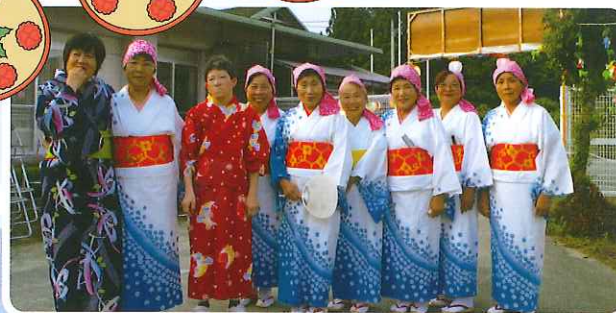
今年も華を添えてくださった、 民謡愛好会のみなさん