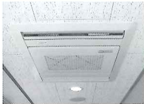
ざおう寮大型空気清浄機3台設置