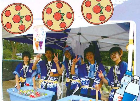
ジュース冷えてま～す