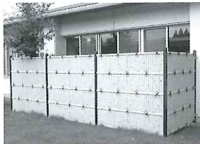
東西浴室垣根改修