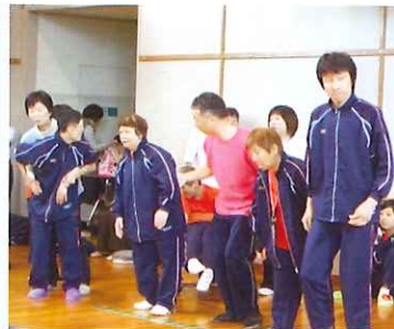
いくぞ～!! 早くスタート鳴らして