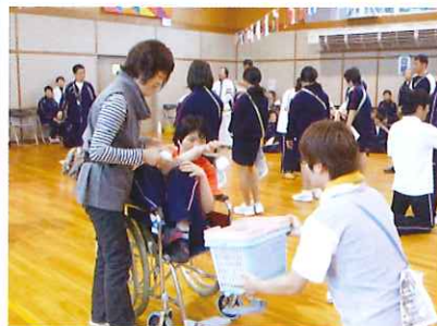
保護者さんと協力してポイツ