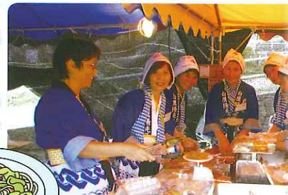
はい。いらっしゃ～い。