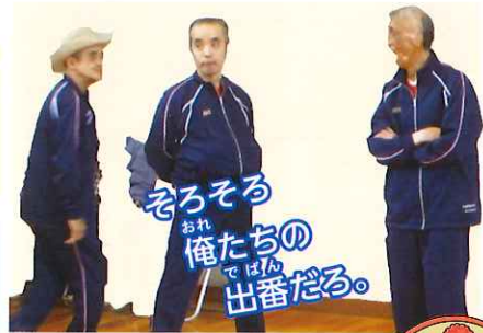
そろそろ 俺たちの 出番だる。