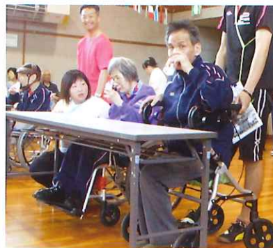
うまそうだる？うまいんだよ。