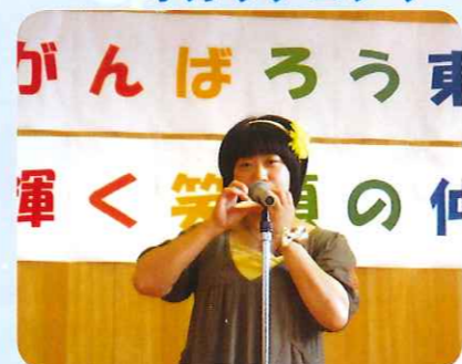
オカリナとウクレレの音色にいやされる〜♡