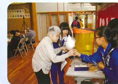
あま〜いわたアメどうぞ。