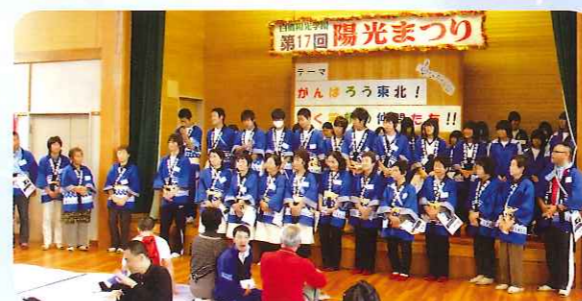
総勢59名のボランティアさん。