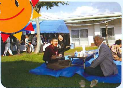
いい天気。外も気持ちいい。