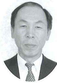
白鷹陽光学園 園長