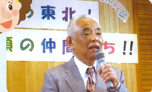
今年も笑顔で楽しみましょ〜!