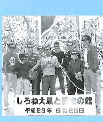
しろね大鳳と歴史の館 平成23年 9月26日

ントもあちこちで開かれ、にぎやかな昼食会場でした。その後マリニピア日本海に移動し、様々な魚類やショーを楽しみました。早めに宿に到着し、月岡温泉「泉慶」のお風呂、食事を満喫しました。