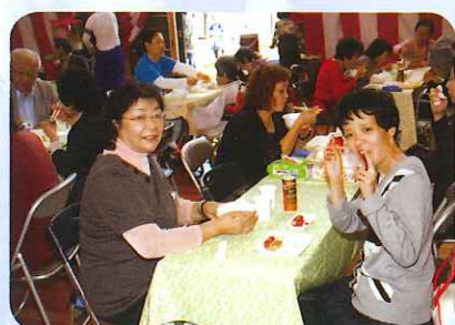
お家の人と一緒にうれしいね。