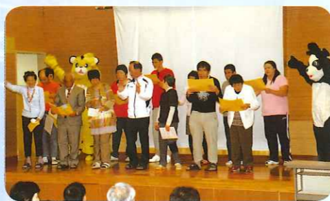
利用者さんの元気な歌声♪