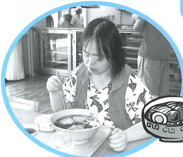
ラーメン大好きなの