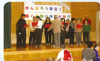
保護者の皆さんの美声。