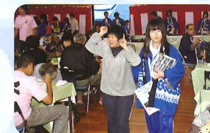
どこに座ろっかな〜。

どう接したらよいか わからない時もあり ましたが、実際に一 緒にしているとすごく楽 しかったです。