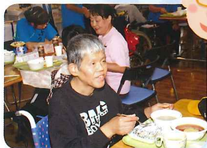
どれから食べよう?