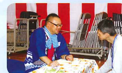
次は何を食べるか相談中?