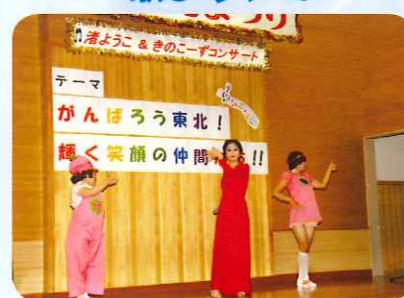
なつかしい歌と楽しいダンス♪