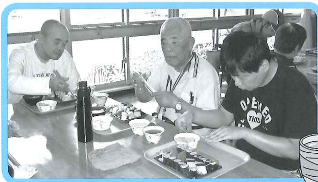
このお寿司おいしいね