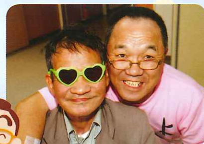
LOVE & Smile!