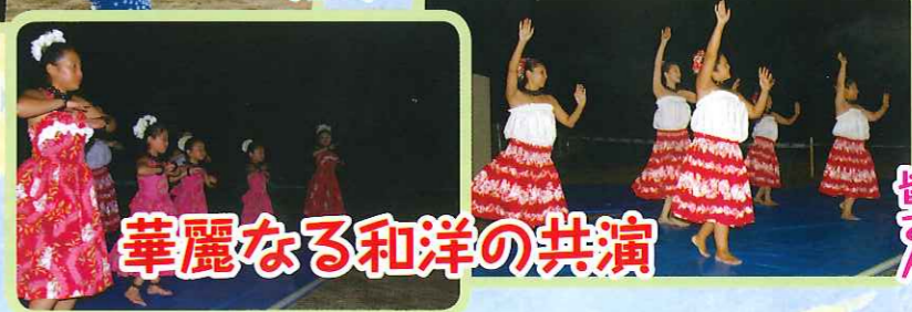
華麗なる和洋の共演