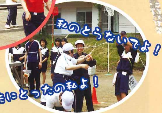
私のとらないてよ!