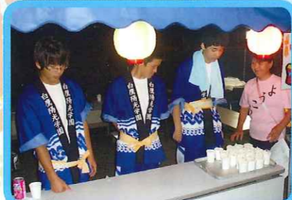
今年も沢山のボランティア ありがとうございました。