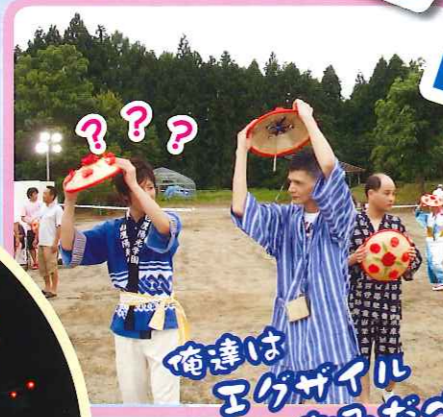
俺達は アゲザイル なみたべ!