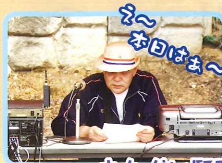
おたがい緊張しますなあ