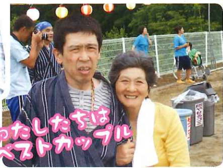
わたしたちは ベストカップル