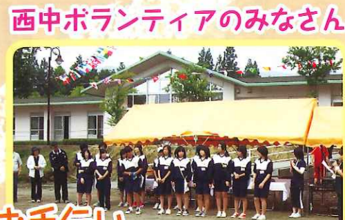
西中ボランティアのみなさん