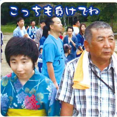
こっすも負けずわ