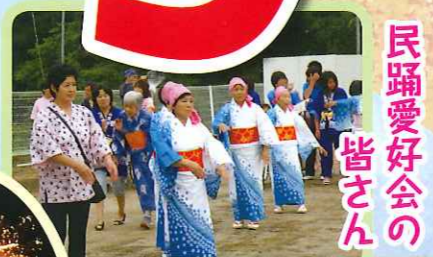
民踊愛好会の 皆さん