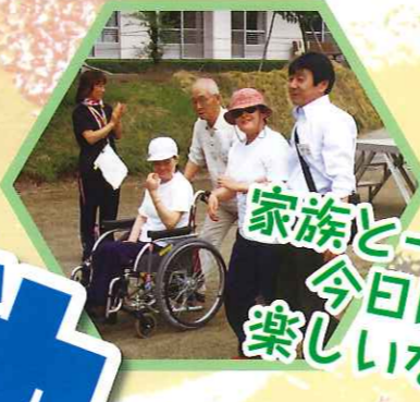
家族と一緒に 今日は 楽しいなあ