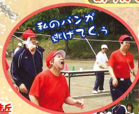
私のパンが 逃げちゃう