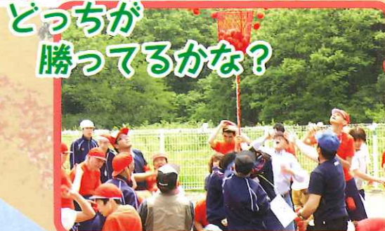
どっちが 勝ってるかな?