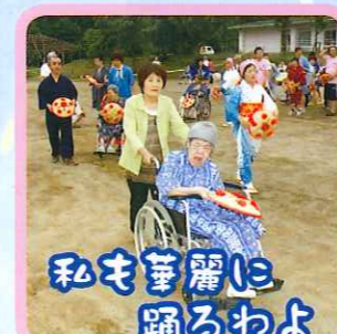
私も華麗に 踊るわよ