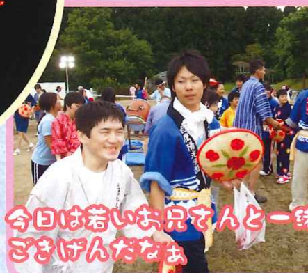
今日は若いお兄さんと一緒に ごきげんだなあ