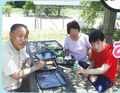
家族で食べるご飯は いつもよりおいしいね。