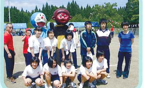
ありがとうございました