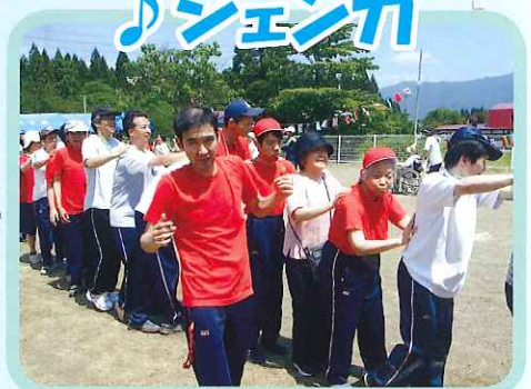
みんなで仲良く踊ろう♪