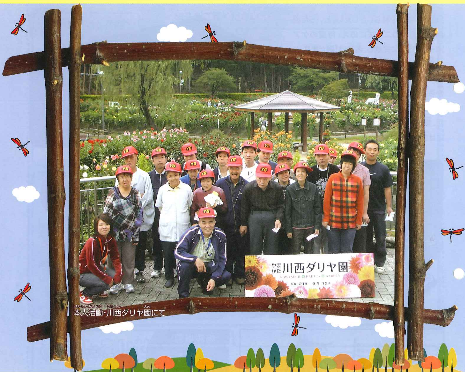
本人活動・川西ダリヤ園にて