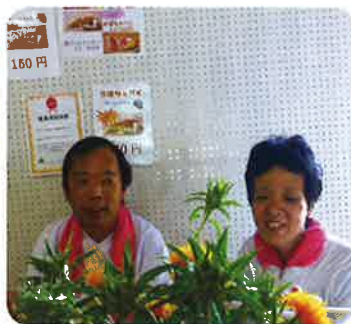
売り子も頑張ってますよ〜

第23回白鷹紅花まつりに今年も参加させていただきました。 たくさんの方で賑わっていて、菓子、はがきもおかけさまでたくさん買っていただきました。