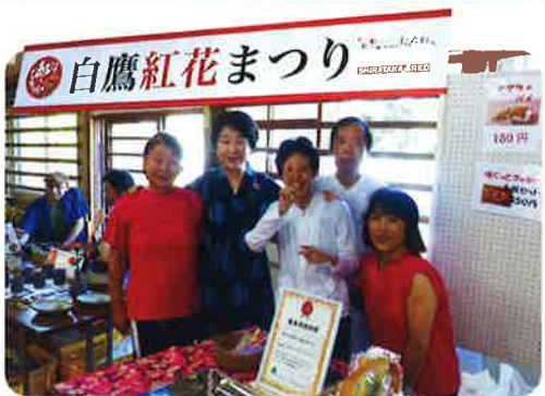
吉村美栄子県知事と一緒に撮影(^_^)