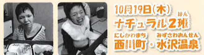
10月19日(木) ナチュラル2班 西川町・水沢温泉