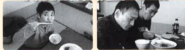
リサイクル紙班 天童市・ゆぴあ