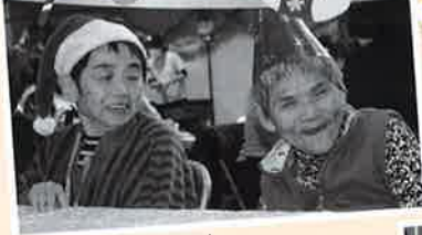
ぼうしにあ 帽子似合ってます

たいいくかん 12月20日(水)体育館で かい おこな クリスマス会を行いました。