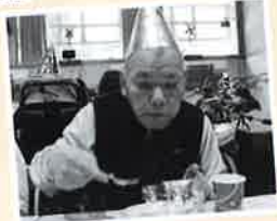
ケーキ いただきまーす！