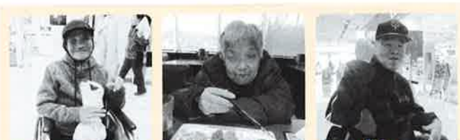
11月9日(木) ナチュラル3班 天童市・イオンモール天童