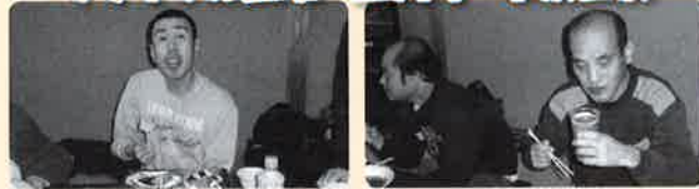
リサイクル缶班 西川町・水沢温泉