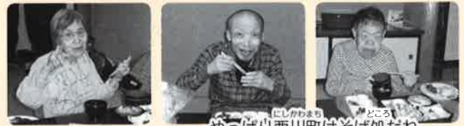
10月12日(木) ナチュラル1班 西川町・水沢温泉