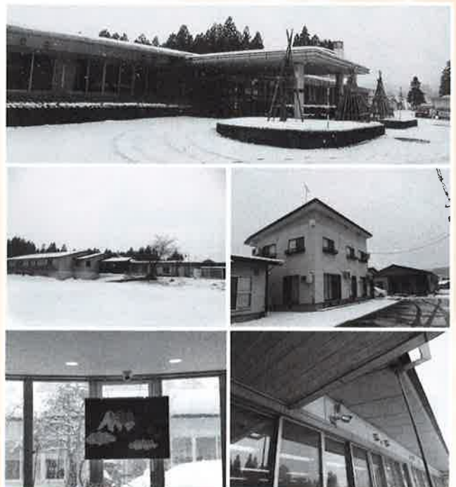
防火・防犯設備の整備 (カメラ・センサーの設置)