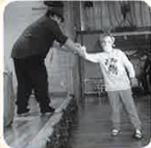
ドラえもんを プレゼント♡