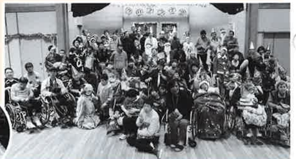
メリークリスマス！