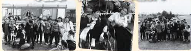
夢創班・女子 南陽市菊祭り