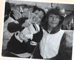
お供の トナカイさんと♪