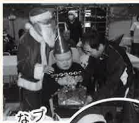
プレゼントは なにかなー？