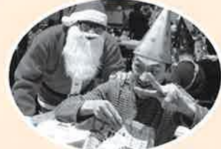
後ろに サンタさん!!