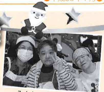
みんなでハイ！チーズ