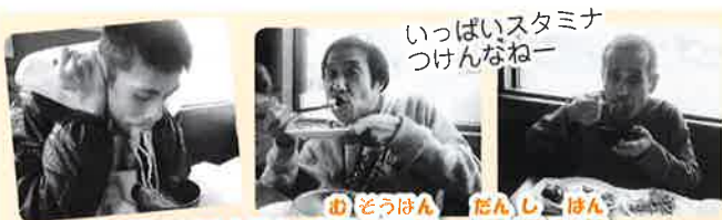
10月16日(月) 夢創班・男子1班