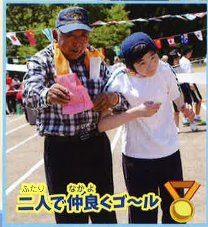
ふたり なかよ 二人で仲良くゴール