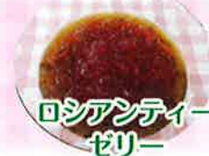
ロシアンティー ゼリー