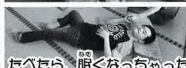
たべたら、眠くなっちゃった〜