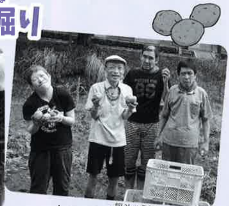
だいしゅうかく じゃがいも大収穫