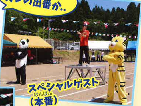
スペシャルゲスト ほんばん (本番)