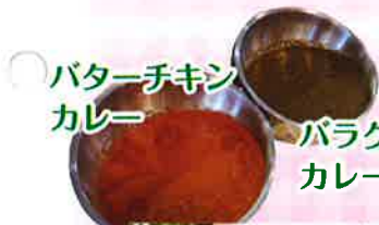
バターチキン カレー