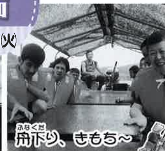
おんこ 舟下り、ちもち〜