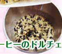
コーヒーのドルチェ