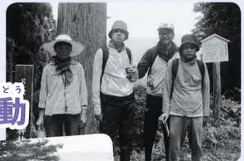
くま で 熊出ないよね？ てはな 手離さないでね...