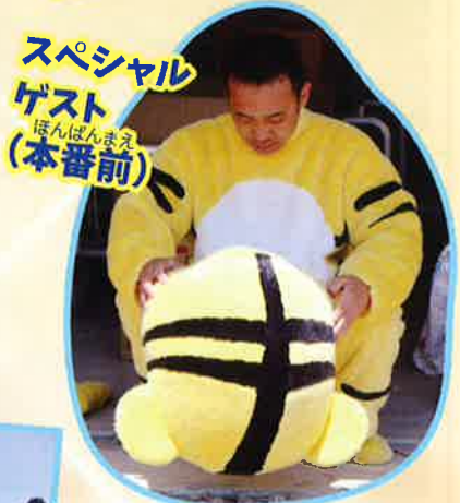
スペシャル ゲスト ほんばんまえ (本番前)