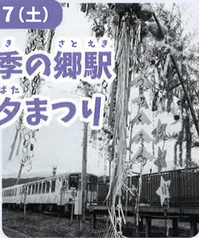
ながい せん たなばた フラワー長井線と七夕