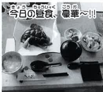
きょうの ちゅうしょく 今日の昼食、豪華〜!!