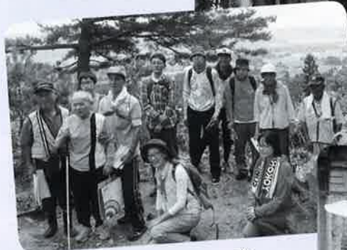
いっしょ みんな一緒にハイ！チーズ