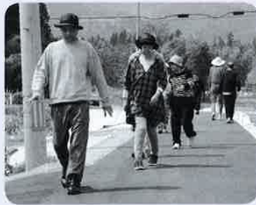
みんな～俺についてこい！