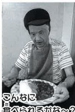
さんなに 食べられるかな〜?