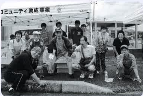
みな グループホームひだまりの皆さん