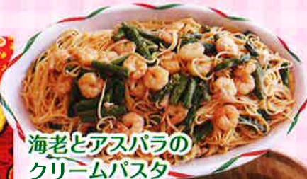
海老とアスパラの クリームパスタ