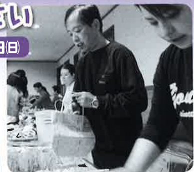
咲楽班の菓子販売もがんばってます。