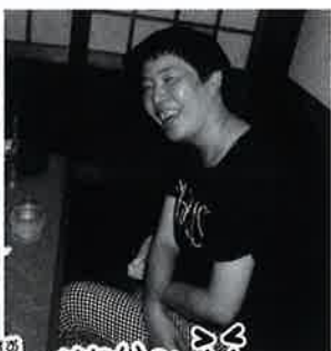
みんな 笑いの 皆の笑顔、かわい〜♡