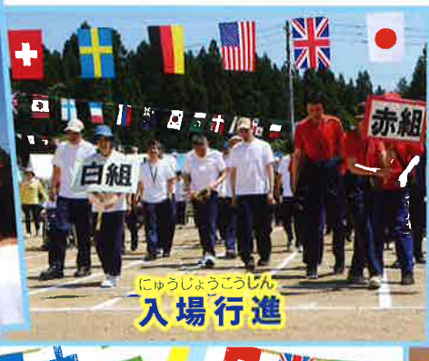
にゅうじょうこうじん 入場行進