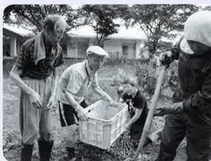
い ポッケに入れないように～