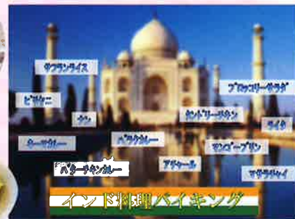
インド料理バイキング