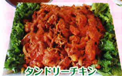
タンドリーチキン