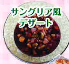
サンテリア風 デザート