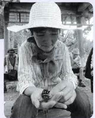
まつ 松ぼっくり かわいいねー