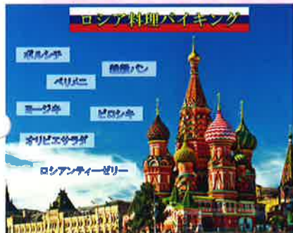
ロシア料理バイキング