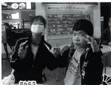
だいす さんごろう 大好きな担当さんとハイチーズ