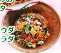
パーニャカウダ サラダ