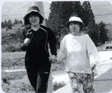
わね は ある はい！胸張って歩いてね！ ねこ せ 猫背はだめよ！