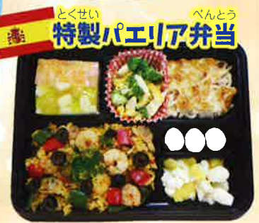
とくせい べんとう 特製パエリア弁当