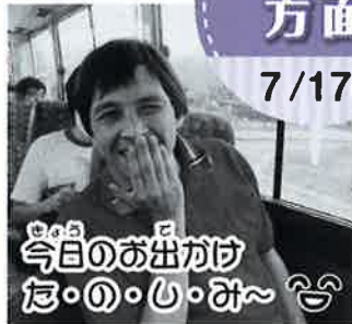
きょうのお出かけ ほ・の・お・お〜♡