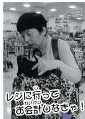
レジャー行くと かいりい お会計しなまっ!