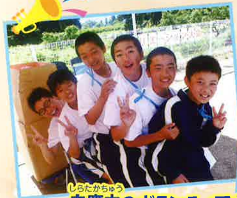
しらたかちゅう 白鷹中のボランティアさんも大活躍でした