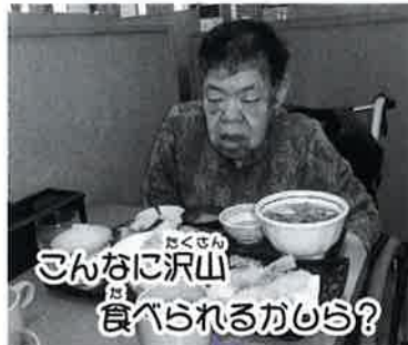
さんなに ぶくろん 食べられるかおは?