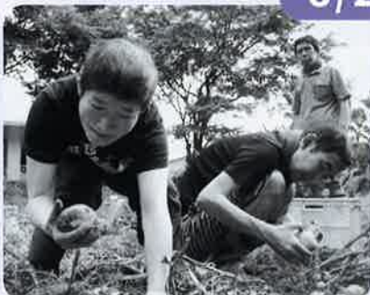
ようこうがくえんはたけ りっば 陽光学園畑の立派なジャガイモ～